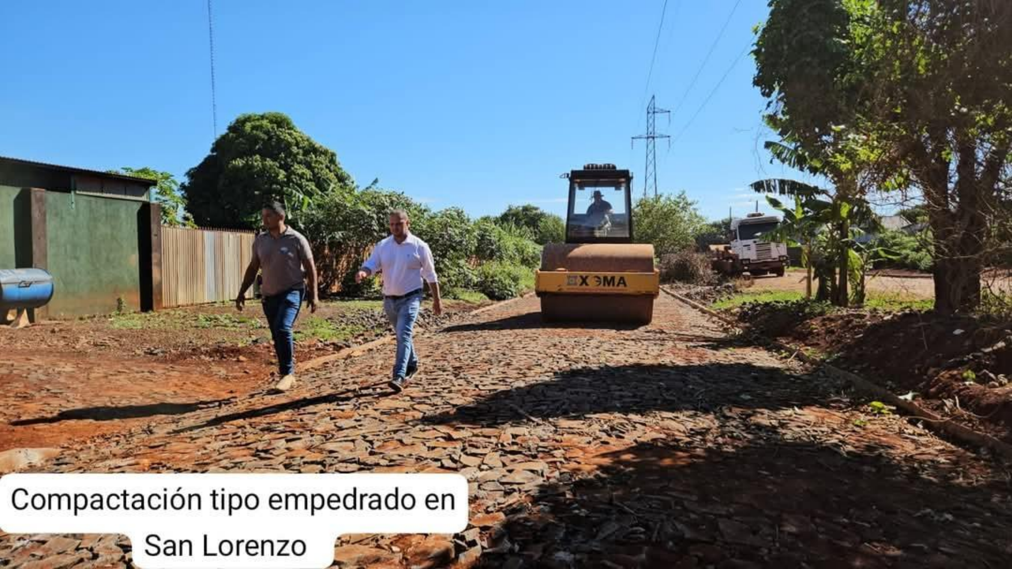
Compactación tipo empedrado en San Lorenzo